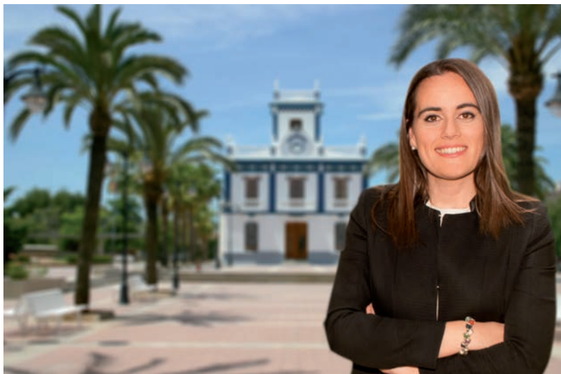
Esther Lara Fonfría Alcaldeessa-Presidenta de l'Ajuntament de les Alqueries